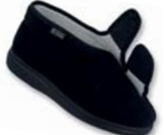
OR 986M003 čierna Veľkosti: 42-46