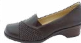
KM 9330/hnedá Veľkosti: 36-43 Šírka: G1/2 - H