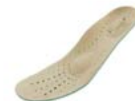
NÁHRADNÁ VLOŽKA Veľkosti: 36-43