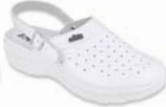
OR 157M102 Veľkosti: 42-46