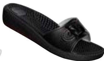
SM 1/60 Veľkosti: 36-42