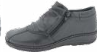
KM 9158/čierna Veľkosti: 36-41 Šírka: H - H1/2