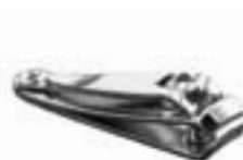
PL 355 Klieštiky na nechty 5,5 cm