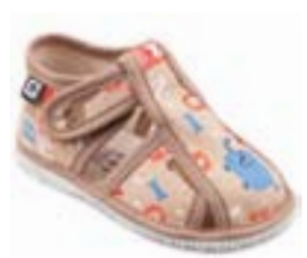
RA 100015-3/ABB abeceda béžová Vel'kosti: 17-26