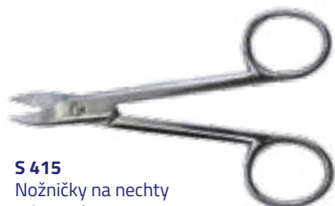
S 415 Nožničky na nechty robustné