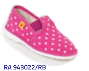
RA 943022/RB ružová bodka Vel'kosti: 27-34