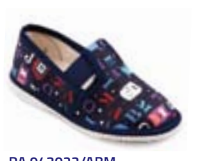
RA 943022/ABM abeceda modrá Vel'kosti: 27-34