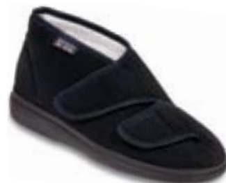
OR 986M003 čierna Veľkosti: 42-46