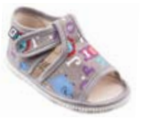
RA 100014-3/ABG abeceda šedá Vel'kosti: 20-30