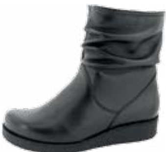
KM 9092/čierna Veľkosti: 36-42 Šírka: H - H1/2