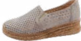
KM 9907/běžová Veľkosti: 36-41 Šírka: H