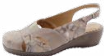
KM 9482/sv. hnedá Veľkosti: 36-41 Šírka: H