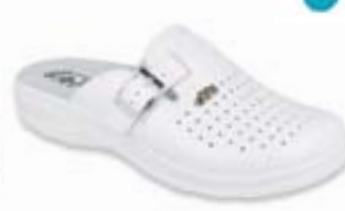
OR 157M104 Veľkosti: 41-46