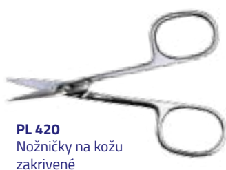
PL 420 Nožničky na kožu zakrivené