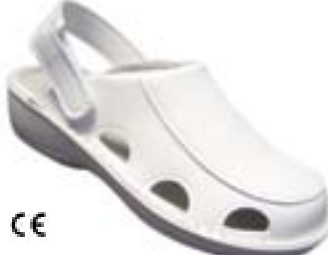
CE EL 91112B/10 Veľkosti: 35-41 NA OBJEDNÁVKU