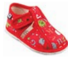
RA 100015-3/ABC abeceda červená Vel'kosti: 17-26