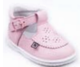
RA 0302-1N/LOLAROSE Zvršok: koža-NAPA Veľkosti: 18-21