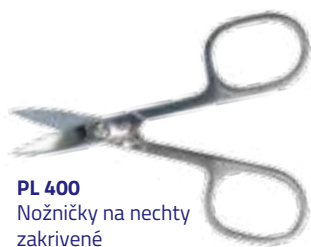
PL 400 Nožničky na nechty zakrivené