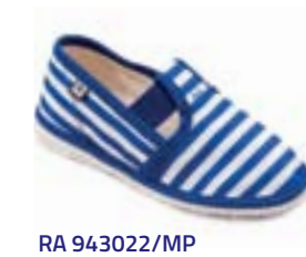
RA 943022/MP modrý pásik Vel'kosti: 27-34