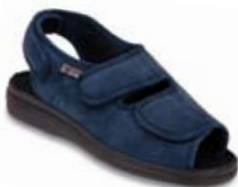
OR 676D003 tmavo modrá Veľkosti: 36-41