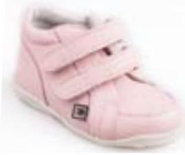
RA 0300-7N/RUŽENÍN Zvršok: koža-NAPA Veľkosti: 18-21