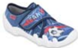
BF-SKATE Y chlapčenské Zvršok: textil Veľkosti: 31-36