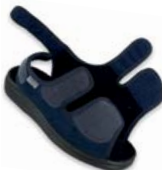
OR 676D003 tmavo modrá Veľkosti: 36-41