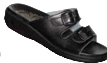
SF 2/60 Veľkosti: 36-42