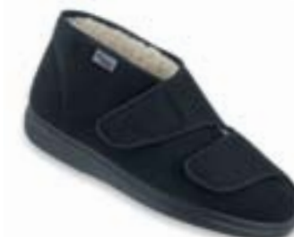
OR 986M011 čierna Veľkosti: 42-46 VLNENÁ PODŠÍVKA