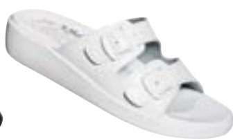
SF 2/10 Veľkosti: 36-42