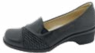
KM 9330/čierna Veľkosti: 36-43 Šírka: G1/2 - H