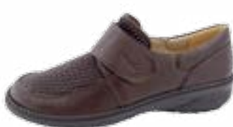
KM 9206/hnedá Veľkosti: 36-42 Šírka: H - H1/2