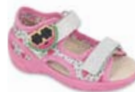
BF-SUNNY X dievčenské Zvršok: textil Veľkosti: 26-30

Ľahká textilná obuv odporúčaná ako prezúvková obuv. Vnútri je použitá mäkká, komfortná výstelka Soft B-system, podošva je elastická a priedušná, čo obmedzuje potenie nôh.