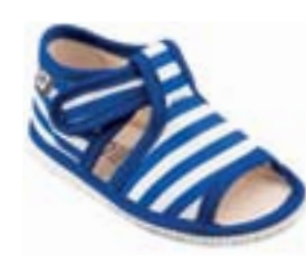
RA 100014-3/MP modrý pásik Vel'kosti: 20-30