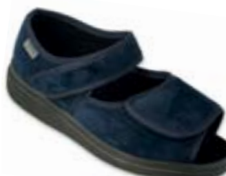
OR 989M007 tmavo modrá Veľkosti: 42-46