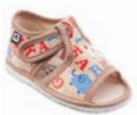
RA 100014-3/ABB abeceda béžová Vel'kosti: 20-30