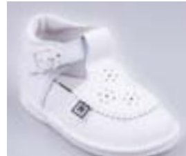
RA 0302-1N/ALŽBETA Zvršok: koža-NAPA Veľkosti: 18-21