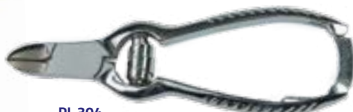
PL 304 Kliešte na nechty s pružinou