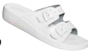
SM 2/10 Veľkosti: 36-42