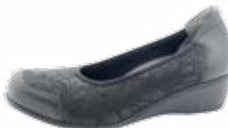
KM 9753/čierna Veľkosti: 36-41 Šírka: H