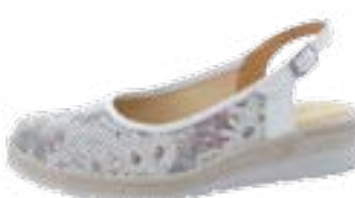
KM 9493/biela Veľkosti: 36-41 Šírka: H