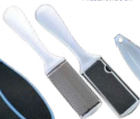
PL 560 Rašpľa na zrohovatenú kožu