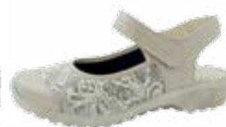
KM 9297/běžová Veľkosti: 36-41 Šírka: H