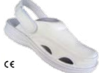
CE EL 91112PB/10 Veľkosti: 42-46 NA OBJEDNÁVKU