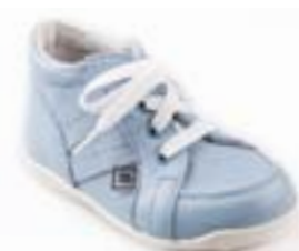
RA 0300-5N/MATTHEW Zvršok: koža-NAPA Veľkosti: 18-21