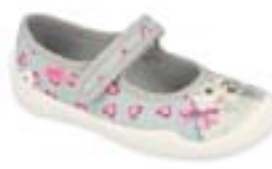
BF-BLANCA X dievčenské Zvršok: textil Veľkosti: 25-30