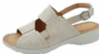
KM 9298/běžová Veľkosti: 36-41 Šírka: H