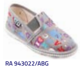
RA 943022/ABG abeceda šedá Vel'kosti: 27-34