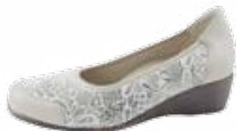
KM 9753/běžová Veľkosti: 36-41 Šírka: H