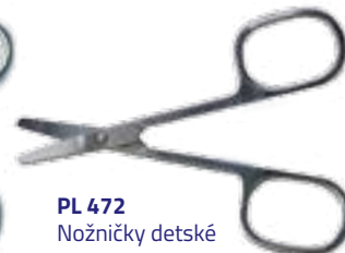
PL 472 Nožničky detské BABY