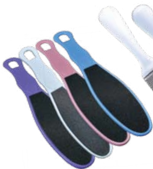
PL 500 Pilník na zrohovatenú kožu