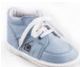
RA 0300-1N/CHARLIE Zvršok: koža-NAPA Veľkosti: 18-21