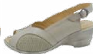
KM 9284/běžová Veľkosti: 36-41 Šírka: H