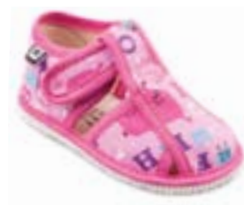
RA 100015-3/ABR abeceda ružová Vel'kosti: 17-30