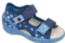
BF-SUNNY X chlapčenské Zvršok: textil Veľkosti: 26-30