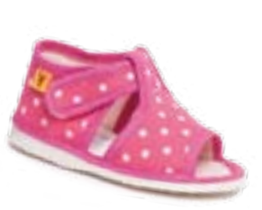
RA 100014-3/RB ružová bodka Vel'kosti: 20-30