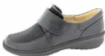
KM 9206/čierna Veľkosti: 36-42 Šírka: H - H1/2