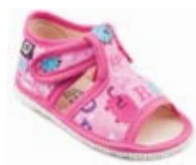
RA 100014-3/ABR abeceda ružová Vel'kosti: 18-30