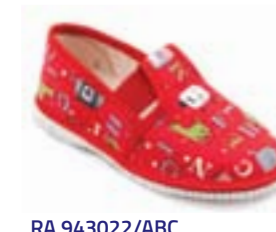
RA 943022/ABC abeceda červená Vel'kosti: 27-34