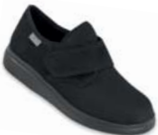
OR 036M006 čierna Veľkosti: 42-46 ELASTICKÝ ZVRŠOK