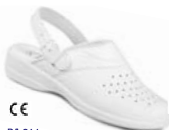
CE BA 044 Veľkosti: 35-42

Podošva: polyuretánová s protišmykovými segmentami