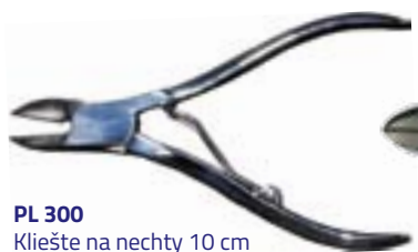
PL 300 Kliešte na nechty 10 cm