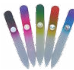
1010 B Pilník sklenený farebný 9 cm MIX farieb