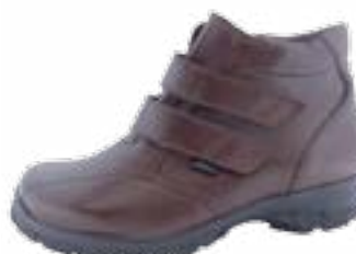
KM 9002/hnedá Veľkosti: 36-43 Šírka: H - K