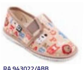
RA 943022/ABB abeceda béžová Vel'kosti: 27-34