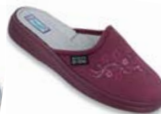
OR 132D014 bordová Veľkosti: 36-41