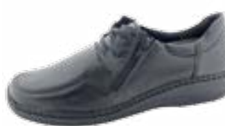
KM 9880/čierna Veľkosti: 36-42 Šírka: H