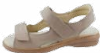
KM 9154/běžová Veľkosti: 36-42 Šírka: H - K