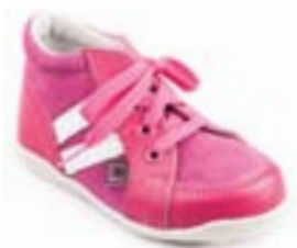
RA 0300-5/VILMA Zvršok: koža-NAPA/VELÚR Veľkosti: 18-21