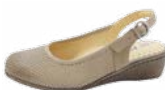
KM 9282/běžová Veľkosti: 36-41 Šírka: H