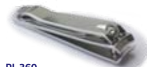
PL 360 Klieštiky na nechty 8 cm