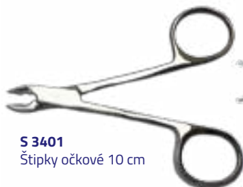
S 3401 Štipky očkové 10 cm