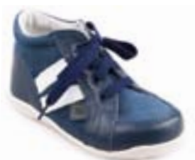
RA 0300-5/ŠIMON Zvršok: koža-NAPA/VELÚR Veľkosti: 18-21