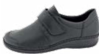
KM 9705/čierna Veľkosti: 36-42 Šírka: H - H1/2