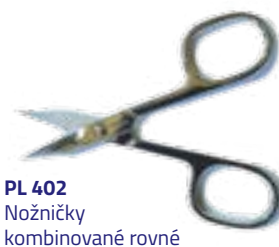
PL 402 Nožničky kombinované rovné