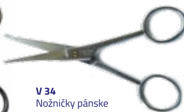
V 34 Nožničky pánske s olivkou