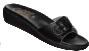
SF 1/60 Veľkosti: 36-42