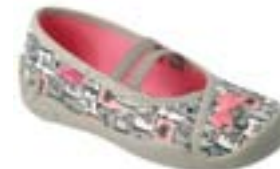
BF-BLANCA Y dievčenské Zvršok: textil Veľkosti: 31-36