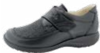
KM 9397/čierna Veľkosti: 36-43 Šírka: H - H1/2