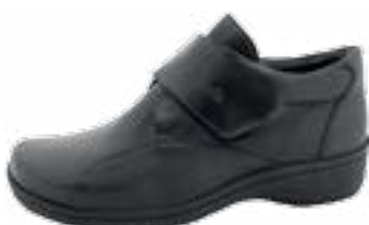
KM 9027/čierna Veľkosti: 36-41 Šírka: H - H1/2

Zimná dámska profylaktická obuv je vyrobená z kvalitnej prírodnej kože, širšia špička poskytuje dostatočný priestor pre prsty. Obuv je zateplená a podošva má dobré izolačné a protišmykové vlastnosti. Je vyrábaná na širšom kopyte.