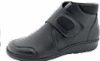
KM 9726/čierna Veľkosti: 36-42 Šírka: H - K