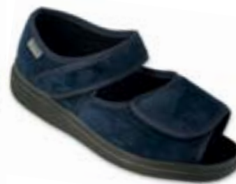
OR 989D004 tmavo modrá Veľkosti: 36-41