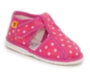
RA 100015-3/RB ružová bodka Vel'kosti: 17-26