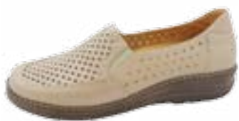
KM 9208/běžová Veľkosti: 36-42 Šírka: H