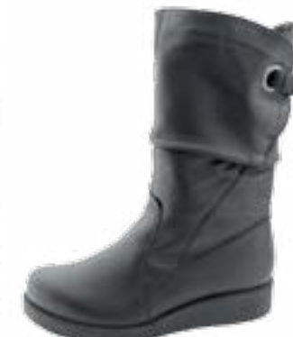
KM 9293/čierna Veľkosti: 36-42 Šírka: H - H1/2