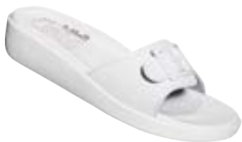
SF 1/10 Veľkosti: 36-42

Zvršok: syntetická koža s textilnou podšívkou, Stielka: anatomicky tvarovaná, povrch zo syntetickej kože, Podošva: polyuretánová