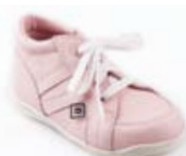
RA 0300-5N/NAŠŤA Zvršok: koža-NAPA Veľkosti: 18-21