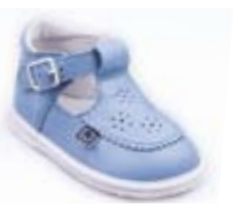
RA 0302-1N/BABEL Zvršok: koža-NAPA Veľkosti: 18-21