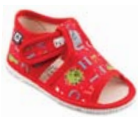
RA 100014-3/ABC abeceda červená Vel'kosti: 20-30