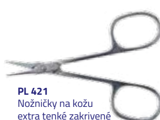
PL 421 Nožničky na kožu extra tenké zakrivené