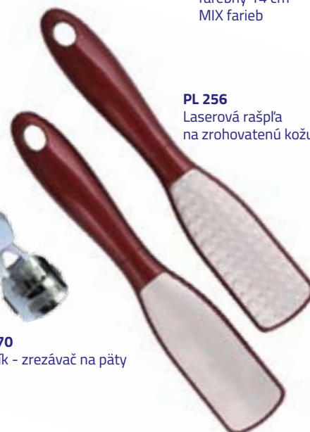
PL 256 Laserová rašpľa na zrohovatenú kožu