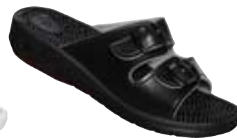
SM 2/60 Veľkosti: 36-42

Rehabilitačná obuv s anatomicky tvarovanou, vymäččenou stielkou.