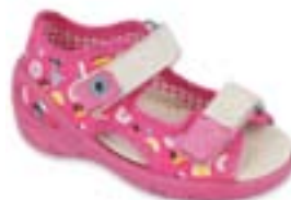
BF-SUNNY P dievčenské Zvršok: textil Veľkosti: 20-25