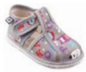
RA 100015-3/ABG abeceda šedá Vel'kosti: 17-26