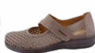
KM 9879/sv. hnedá Veľkosti: 36-42 Šírka: H