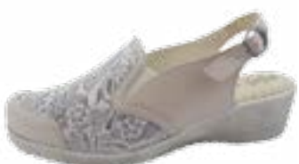
KM 9904/běžová Veľkosti: 36-41 Šírka: H