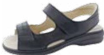
KM 9154/čierna Veľkosti: 36-42 Šírka: H - K