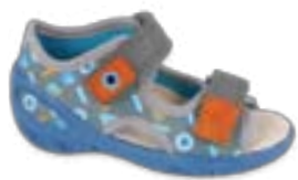
BF-SUNNY P chlapčenské Zvršok: textil Veľkosti: 20-25

Sandálky SUNNY sú vhodné na vonok aj do vnútra. Majú koženú stielku, ktorá sa ľahko udržiava čistá a hygienická a výrazne zlepšuje komfort používania obuvi v teplých dňoch.