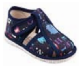
RA 100015-3/ABM abeceda modrá Vel'kosti: 17-30