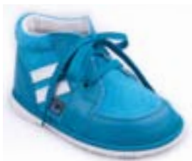
RA 0300-1/OLIVER Zvršok: koža-NAPA/VELÚR Veľkosti: 18-21