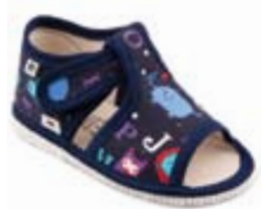
RA 100014-3/ABM abeceda modrá Vel'kosti: 18-30