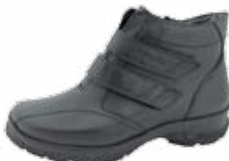
KM 9002/čierna Veľkosti: 36-43 Šírka: H - K