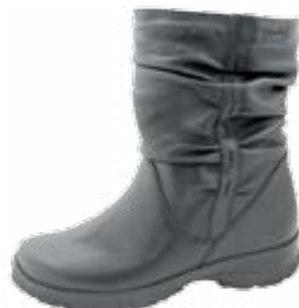
KM 9832/čierna Veľkosti: 36-43 Šírka: H - H1/2