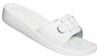
SM 1/10 Veľkosti: 36-42

Zvršok: syntetická koža s textilnou podšívkou, Stielka: masážna, syntetická, Podošva: polyuretánová