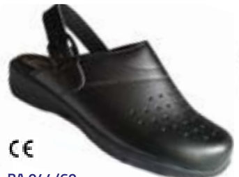
CE BA 044/60 Veľkosti: 35-42