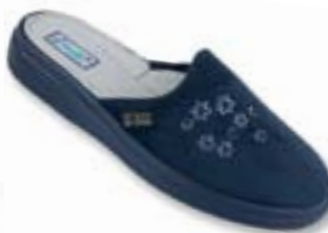
OR 132D012 tmavo modrá Veľkosti: 36-41