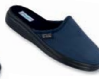
OR 132M006 tmavo modrá Veľkosti: 42-46