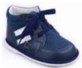
RA 0300-1/MATEJ Zvršok: koža-NAPA/VELÚR Veľkosti: 18-21

Kvalitná detská obuv od slovenského výrobcu. Vyrobená zásadne z prírodných materiálov - koža, bavlna. Obuv má certifikát o zdravotnej a hygienickej nezávadnosti.