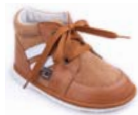
RA 0300-1/MATILDA Zvršok: koža-NAPA/VELÚR Veľkosti: 18-21