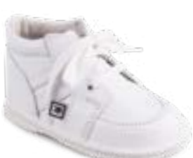
RA 0300-1N/ADAM Zvršok: koža-NAPA Veľkosti: 18-21