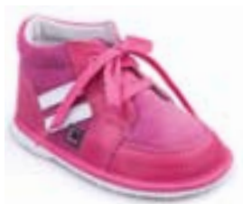
RA 0300-1/TÁŇA Zvršok: koža-NAPA/VELÚR Veľkosti: 18-21