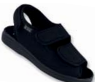
OR 676M007 čierna Veľkosti: 42-46