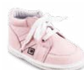
RA 0300-1N/ALLY Zvršok: koža-NAPA Veľkosti: 18-21