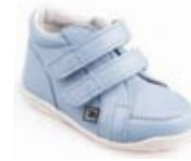
RA 0300-7N/AKVAMARÍN Zvršok: koža-NAPA Veľkosti: 18-21