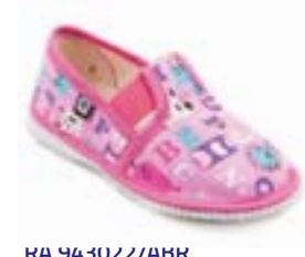
RA 943022/ABR abeceda ružová Vel'kosti: 27-34