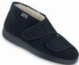
OR 986D011 čierna Veľkosti: 36-41 VLNENÁ PODŠÍVKA