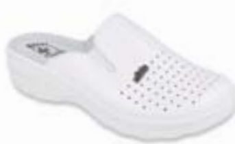
OR 157D006 Veľkosti: 36-41