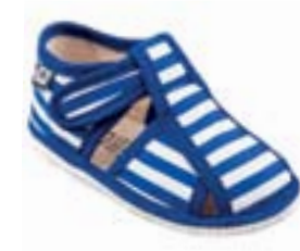
RA 100015-3/MP modrý pásik Vel'kosti: 17-26