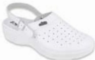
OR 157D002 Veľkosti: 36-41