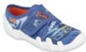
BF-SKATE X chlapčenské Zvršok: textil Veľkosti: 25-30

Ľahká textilná obuv odporúčaná ako prezúvková obuv. Vnútri je použitá mäkká, komfortná výstelka Soft B-system, podošva je elastická a priedušná, čo obmedzuje potenie nôh.